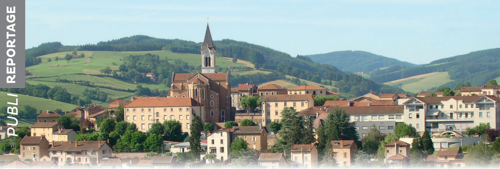
Bourg-de-Thizy et les monts du Beaujolais