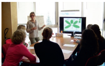
La formation des points de vente : un engagement essentiel pour Diétaroma

« Expliquer pourquoi et comment c'est efficace, avec quel dosage, ça n'existait pas vraiment en phyto-aromathérapie, continue Arnaud. Avant, cela relevait plutôt d'une démarche empirique, on s'intéressait peu de savoir si ça marchait ». L'étape suivante consiste maintenant à partager ce savoir-faire qui fait la fierté de la société avec les magasins, pour les accompagner dans leur montée en compétence et faire de Diétaroma « la » référence en matière d'efficacité, domaine où la marque possède une forte légitimité.